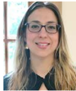
PAR ROXANNE OUELLET CONSEILLÈRE EN RELATIONS DE TRAVAIL